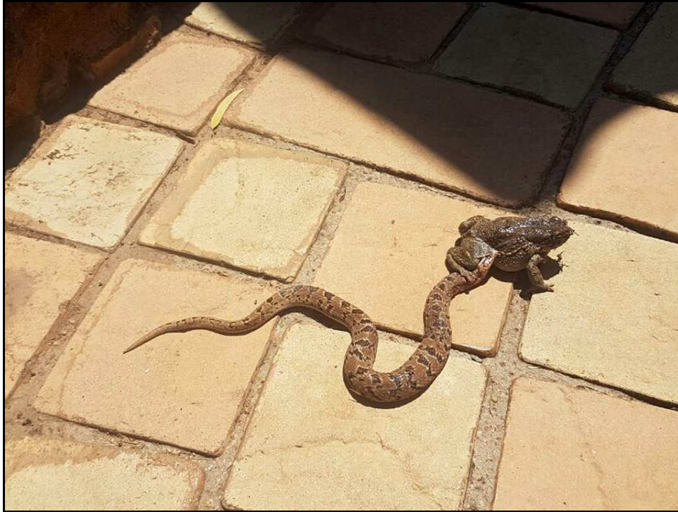
A Night Adder which has just caught a Guttural Toad... eventually both ended up in the pool! 'n Nagadder met sy skurwepadda prooi - en toe eindig albei in die swembad!

Folks, that's all from me for this year. Hope the festive season is peaceful and relaxing and for those who go on holiday, be safe on the roads!