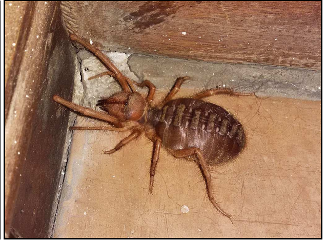
Red Roman/Rooi Romanspinnekop (wat nie 'n ware spinnekop is nie!) Foto/Photo 1 Louise Nell Zwartkrans, Foto/Photo2 Garfield Krige SCE 129