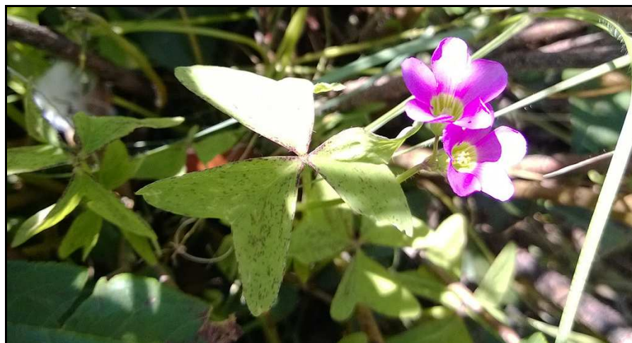
Oxalis obliquifolia (Wild Sorrel) (Wilde suring) SCE 129