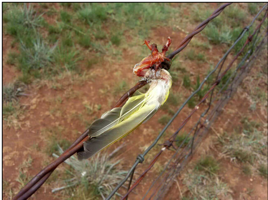
Fresh from the Fiscal Shrike's pantry - poor weaver! / Vars uit die laksman se spens - arme vink! SCE 129