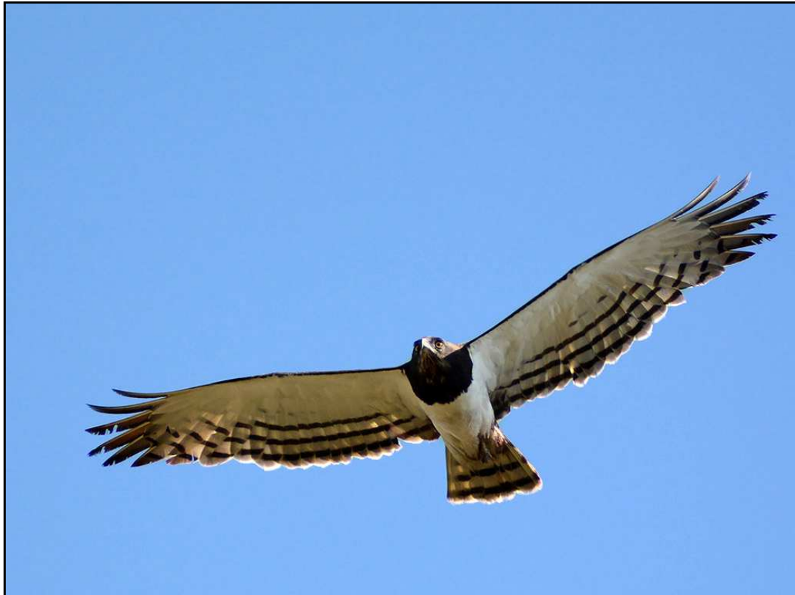
Our beautiful Black-chested Snake Eagles in flight above our Estate. Top Henrietta the female and below, Kgosi, the male. Ons eie grasiëuse Swartborsslangarendpaarin vlug bokant ons Estate. Bo, Henrietta die wyfie en onder, Kgosi, die mannetjie. SCE 129