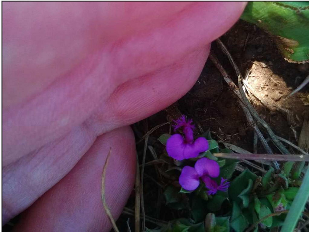
Polygala amatymbica - that's how small some of our wild flowers are - and yet so pretty! Kyk hoe klein en tog so mooi! SCE 129