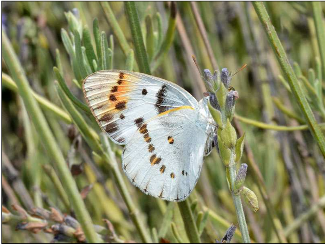
Yep folks, it is the same butterfly! The Scarlet Tip. Ja mense, dis beslis een en dieselfde skoelapper! Skarlakenpuntjie ( Colotis danae annae )