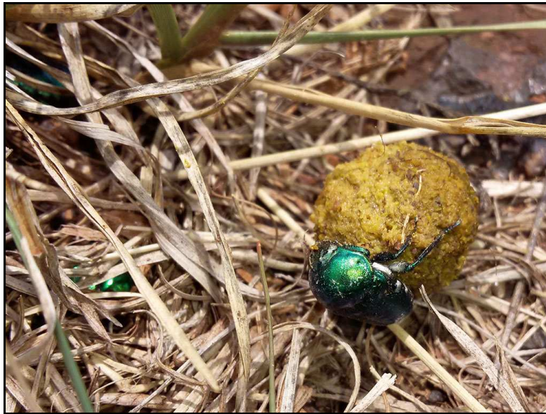
Dung Beetle with its ...er...find! Miskruier met sy ...er... vonds! SCE 129